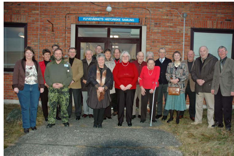
Ansatte og frivillige med hustruer ved Flyvevåbnets historiske samling