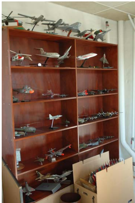
Flymodellerne som har holdt flyttedag