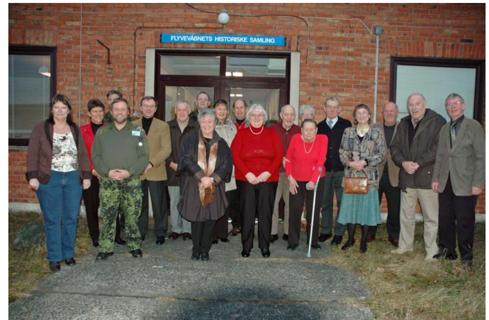
Ansatte og frivillige med hustruer ved Flyvevåbnets historiske samling